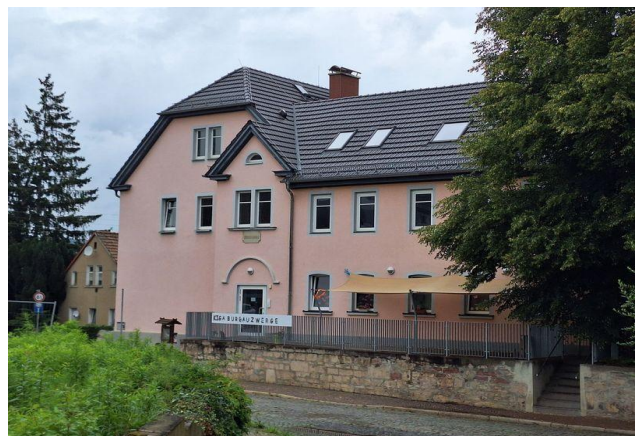
Das Alte Schulhaus – das neue OTR-Büro von Burgau in der 1. Etage (über dem Kindergarten)