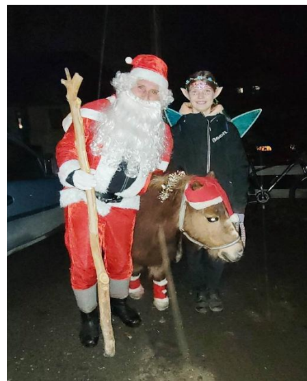
Der Burgauer Weihnachtsmann mit Engelchen