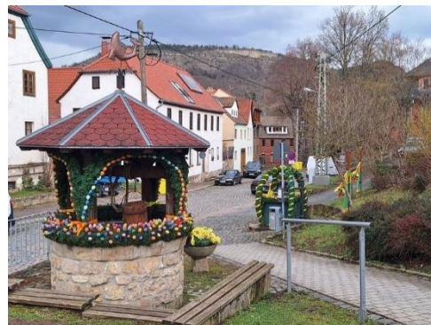
Burgauer Osterbrunnen 2026 in der Geraer Straße