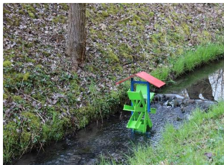
Wasserrad am Felsbach