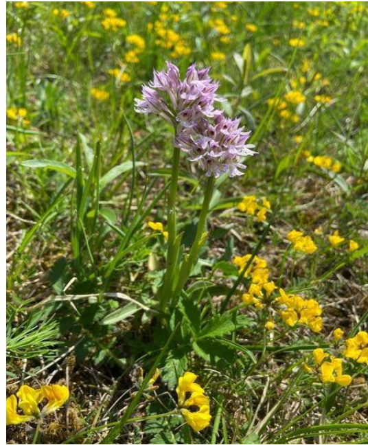
Dreizähniges Knabenkraut Foto und Text: W. Westhus

Bei Dauerregen muss die Wanderung leider ausfallen.