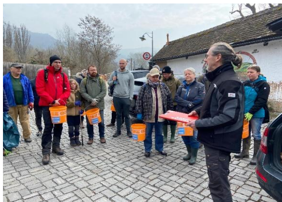
Der Burgauer Ortsteilbürgermeister bei der Einweisung der freiwilligen Helfer beim SaalePUTZ 2026 Foto und Text: W. Westhus

Als Dank für den ehrenamtlichen Einsatz brannte ab 12.00 Uhr im Kirchgarten der Dreifaltigkeitskirche Burgau der Rost. Bei Essen und Getränken bedankte sich der Ortsteilbürgermeister im Namen der Bürgerstiftung für das Engagement der Teilnehmer.