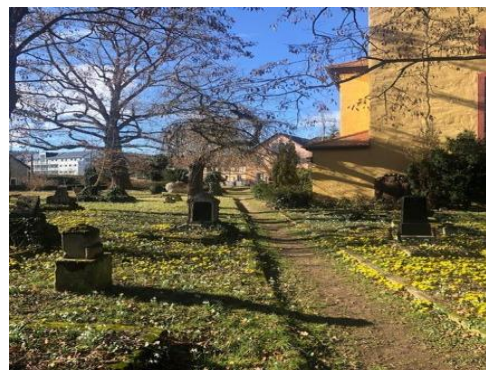
Frühling im Kirchgarten