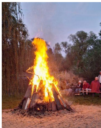
Feuer an der Saale

Am 30.4.26 ist es wieder soweit ! Das Hexenfeuer lodert ab 20 Uhr im Biergarten „Am Wehr“ und spiegelt sich gespenstisch in der Saale.... Ein gemütlicher Treff für die Burgauer.