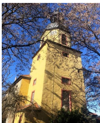
Burgauer Kirche

Vorankündigung: 13.9.26 Deutscher Orgeltag, dazu wird in der Burgauer Kirche eine Konzert-Lesung stattfinden.