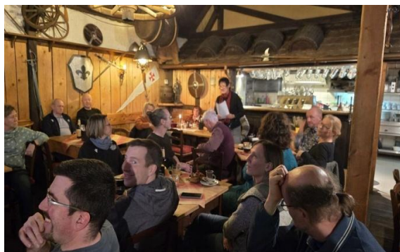
Mitgliederversammlung Ortsverein Burgau 2026