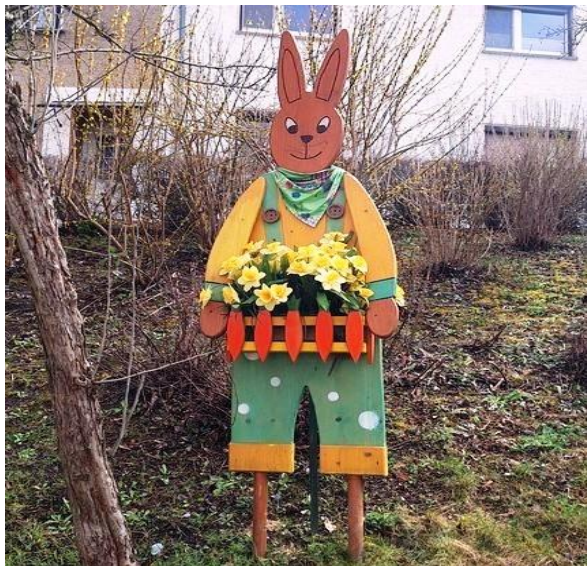
Burgauer Hase, Foto: Renate Mäder