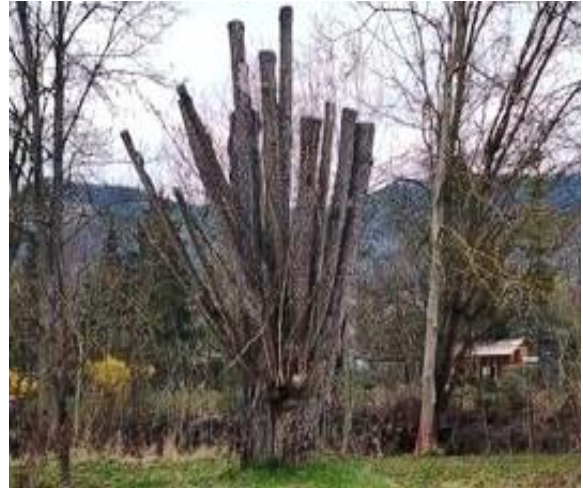
„Bäume“ am Saalebogen