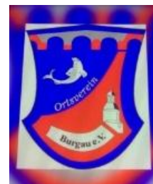
Ortsvereinswappen rot /blau 20 Jahre Ortsverein Burgau e.V. 2006 - 2026